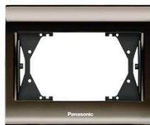
Gniazdo podwójne WBTF0809-5UN