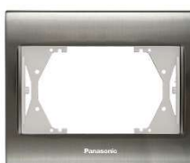
Gniazdo podwójne WBTF0809-5IN